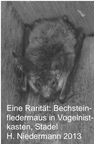
Eine Rarität: Bechsteinfledermaus in Vogelnistkasten, Stadel H. Niedermann 2013

Viele Fledermausarten nutzen als Sommer- und Winterunterschlupf Baumhöhlen. Als Ersatz für diesen Lebensraum weichen sie oftmals in Vogelnist- oder Fledermauskästen aus, wo sie entdeckt werden. Über die Wald bewohnenden Fledermausarten ist wenig bekannt. Sehr spannende Meldungen erreichen uns von Nistkastenreinigern: Sie finden bei der Reinigung der Kästen Fledermäuse oder zumindest ihre Hinterlassenschaften, die Fledermauschegeli.